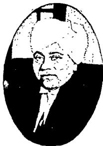
आन. वि. जस्टिस मेहरचन्द महाजन, लाहौर